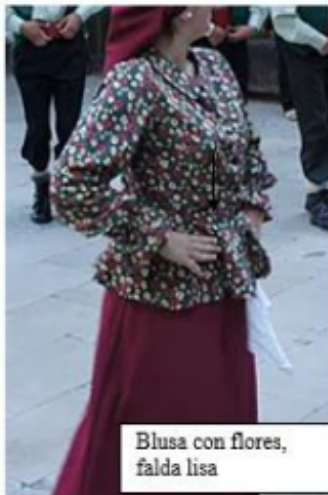
Blusa con flores, falda lisa