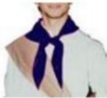
Pañuelo anudado en cuello para varón